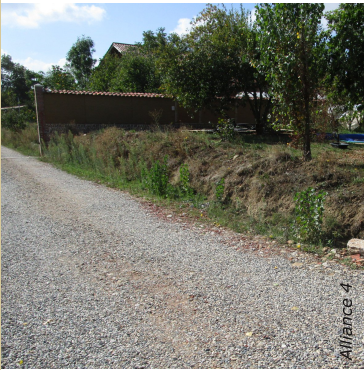
Avant le chantier

Les murs en pierre sèche font partie de nombreux paysages français et sont des ouvrages traditionnels largement répandus.