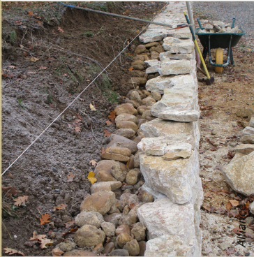
Remplissage de l'arrière du mur avec des galets et des patates.