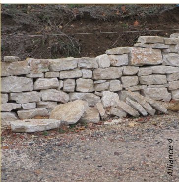
En cours de montage, des pierres plates pour le chapeau sont mises de côté.