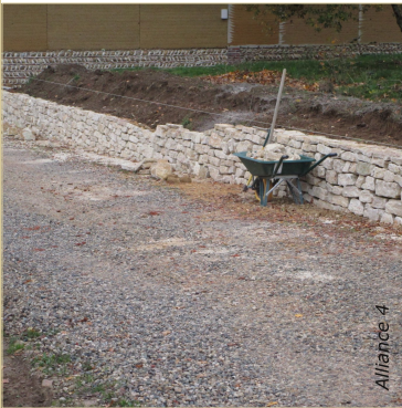
Une brouette contenant les cales et des pierres de petit calibre est à portée de main.