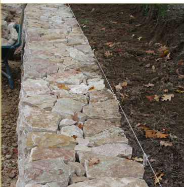
Mise en place du chapeau.