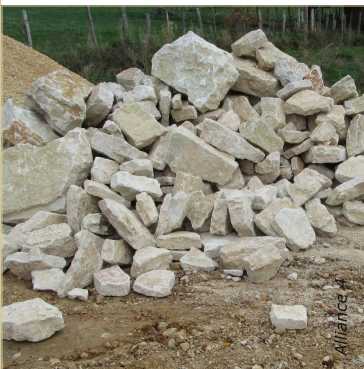
Livraison de pierres à bâtir d'une carrière avoisinante.

Pour aller plus loin, nous vous conseillons le livre Pierre sèche aux éditions Le bec en l'air.