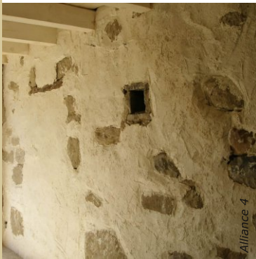
L'enduit chaux/chanvre est parfaitement adapté au bâti ancien. Ici la première couche appliquée grossièrement laisse apparaître certaines pierres du mur d'origine.