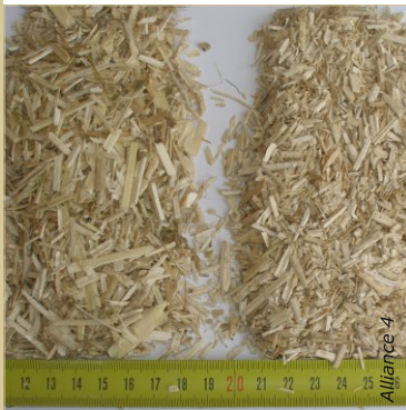
Il existe deux calibres de chènevotte : chènevotte de construction et de finition.