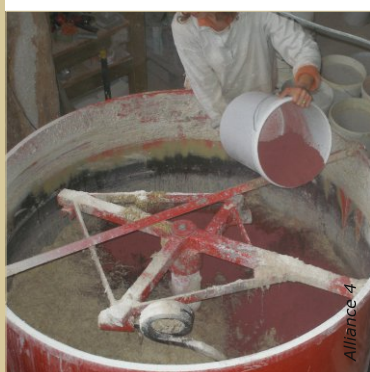
La dernière passe de l'enduit peut être pigmentée. Comme le mortier est riche en liant, les couleurs obtenues pourront être vives.

Il est également possible d'introduire, à sec, machine arrêtée, le chanvre, la ponce et la moitié du liant, d'allumer la machine et d'ajouter rapidement beaucoup d'eau jusqu'à obtenir un mélange bien saturé en eau. Ajouter ensuite le reste de la chaux ou de l'argile progressivement par petites quantités, en alternant avec l'eau.