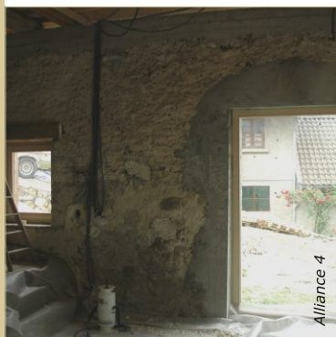
Avant : ponts thermiques autour des menuiseries, gaines et boîtes électriques apparentes, support hétérogène.