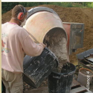
Préparation de l'enduit en bétonnière. La consistance de sortie est bien fluide.