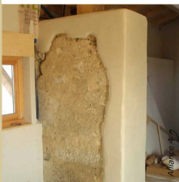
L'enduit chanvre s'utilise aussi en usage purement décoratif : ici des reprises de maçonnerie ont été recouvertes. Le mur ancien a été ainsi mis en valeur.

L'enduit chanvre s'utilise comme correcteur thermique, principalement en intérieur, sur tous supports correctement consolidés et préparés avec un gobetis. Cet enduit est particulièrement indiqué en rénovation du bâti ancien pour homogénéiser les murs hétéroclites ou pour couper la sensation de froid des murs extérieurs massifs.