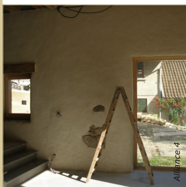
Après : les ponts thermiques ont disparus, les équipements électriques ont été noyés dans l'enduit. Certains éléments anciens ont été conservés : ferrure, pièces de bois, pierres en saillie. Les angles sont arrondis.

LA PRÉPARATION DE L'ENDUIT SE RÉALISE ENVIRON 12 HEURES AVANT LA MISE EN ŒUVRE. CE TEMPS DE REPOS PERMET LE DÉVELOPPEMENT DE LA CHAUX AÉRIENNE ET LES ÉCHANGES ENTRE LES INGRÉDIENTS.