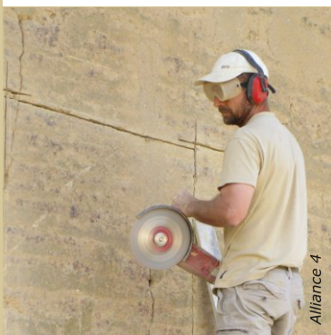
L'utilisation de machines de chantier présentent des risques pour la santé.

Les poussières ne sont jamais anodines, même celles de matériaux naturels. Les poussières de balayage sont parfois chargées d'éléments nocifs, surtout dans les rénovations d'après-guerre. Bien ventiler et porter un masque à poussière ou à filtre selon les cas. Se référer aux informations de sécurité des fabricants de protections.