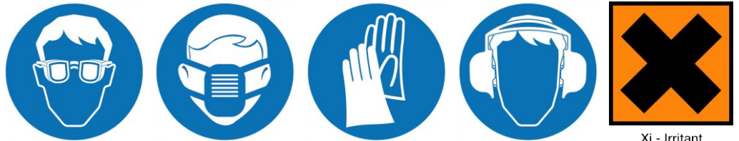
Xi - Irritant

Prenez le temps de lire les étiquettes présentes sur les emballages des matériaux et sur les machines.