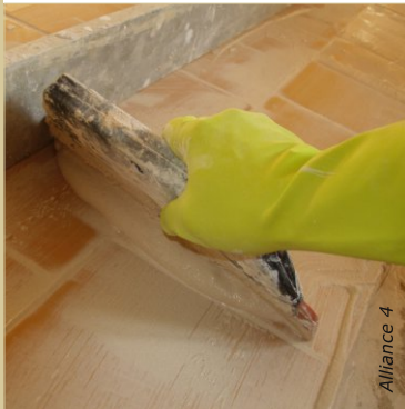
Les gants épais à longue manchette sont obligatoires lors du contact alterné d'eau et de mortier de chaux, notamment lors de la pose des carreaux de terre cuite.