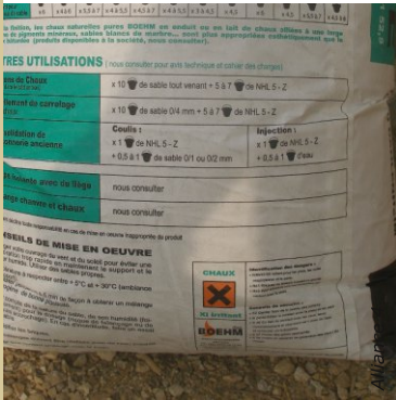
La signalétique sur les emballages vous informe clairement sur les risques et les précautions à prendre.

Pour préserver votre santé sur les chantiers en auto-construction, quelques habitudes sont à adopter.